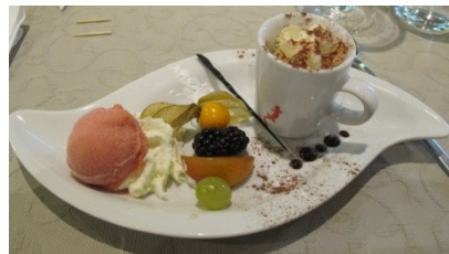
und das passende Dessert dazu